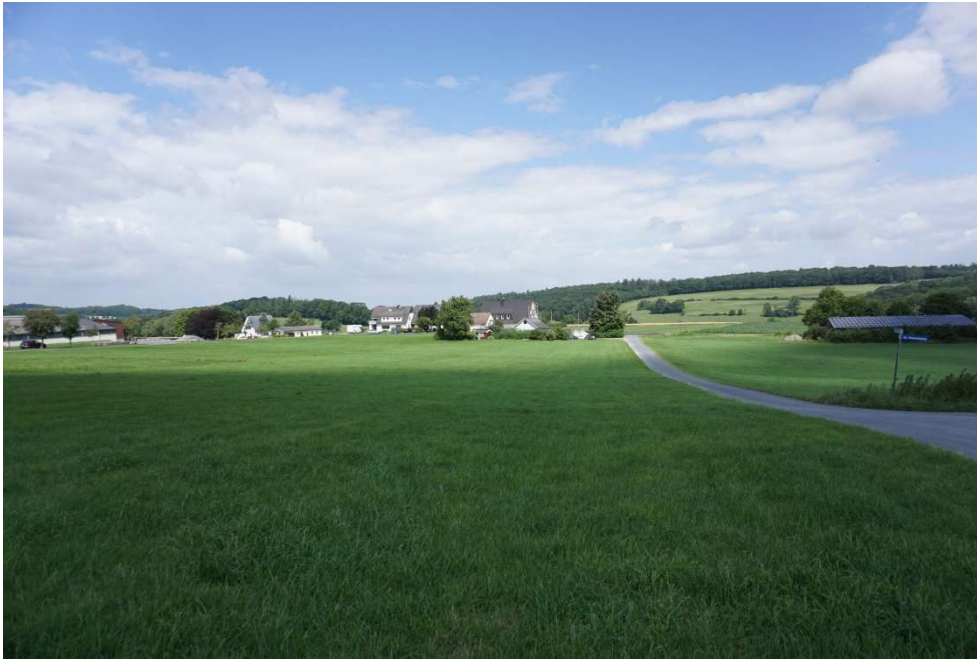
Abb. 5 Blick über das Plangebiet auf die Kompensationsfläche „Flurstück 660“.