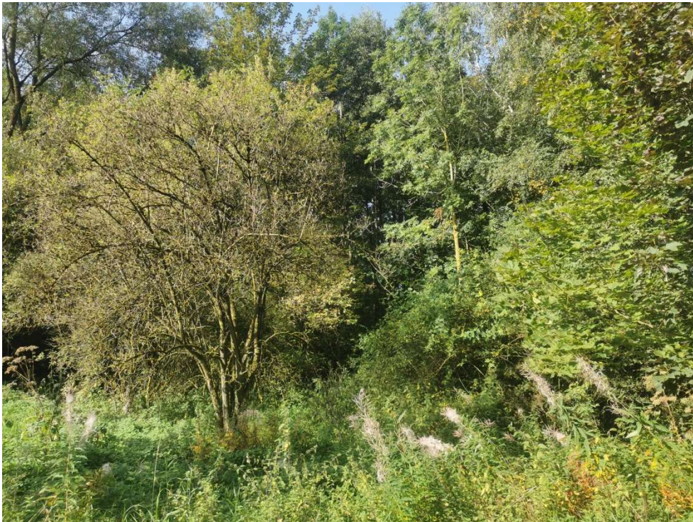
Abb. 4 Blick auf die Kompensationsfläche „Mühlenbruch“.

Zur Kompensation des Eingriffs wird eine Fläche nordöstlich von Rüthen-Kallenhardt herangezogen. Diese befindet sich in der Gemarkung Kallenhardt, Flur 3 und umfasst das Flurstück 583. Dabei handelt es sich um einen knapp 20-jährigen Fichtenmischbestand. Die Fichten werden deutlich (mind. 25 J.) vor Hiebreife entfernt und die Fläche wird mit den verbleibenden lebensraumtypischen Laubgehölzen der weiteren Sukzession überlassen. Aktuell ist die Fläche mit Bergahorn, Birke, Esche und Weide (Stammdurchmesser bis ca. 30 cm) durchsetzt sowie einer Hochstaudenflur. Eine Aufforstung mit Fichte oder anderen nicht lebensraumtypischen Baumarten ist nicht mehr vorgesehen. Nachwachsende, nicht standortgerechte Gehölze (z.B. Fichten) sollen regelmäßig entfernt werden.