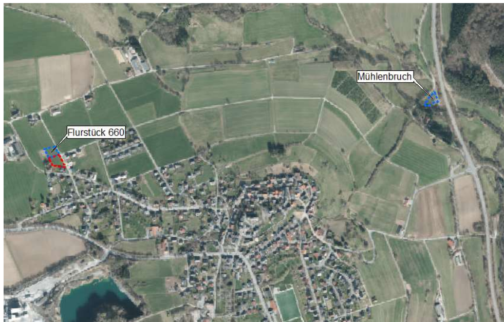
Abb. 3 Lage der Kompensationsflächen (blaue Strichlinie) zu dem Plangebiet (rote Strichlinie).