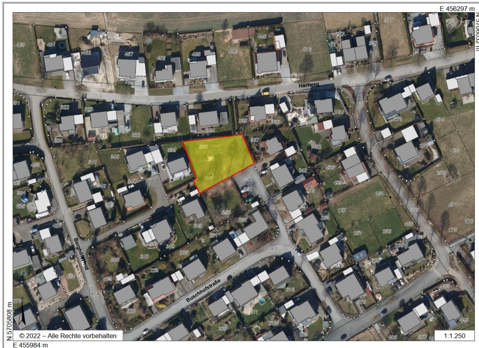
Katastrerauszug samt Luftbild

Tel.: 02952/818116 E-Mail: c.scholz@ruethen.de